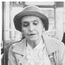
die alte Frau