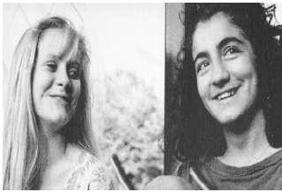
Die beiden Mädchen