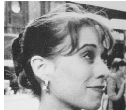
die junge Frau