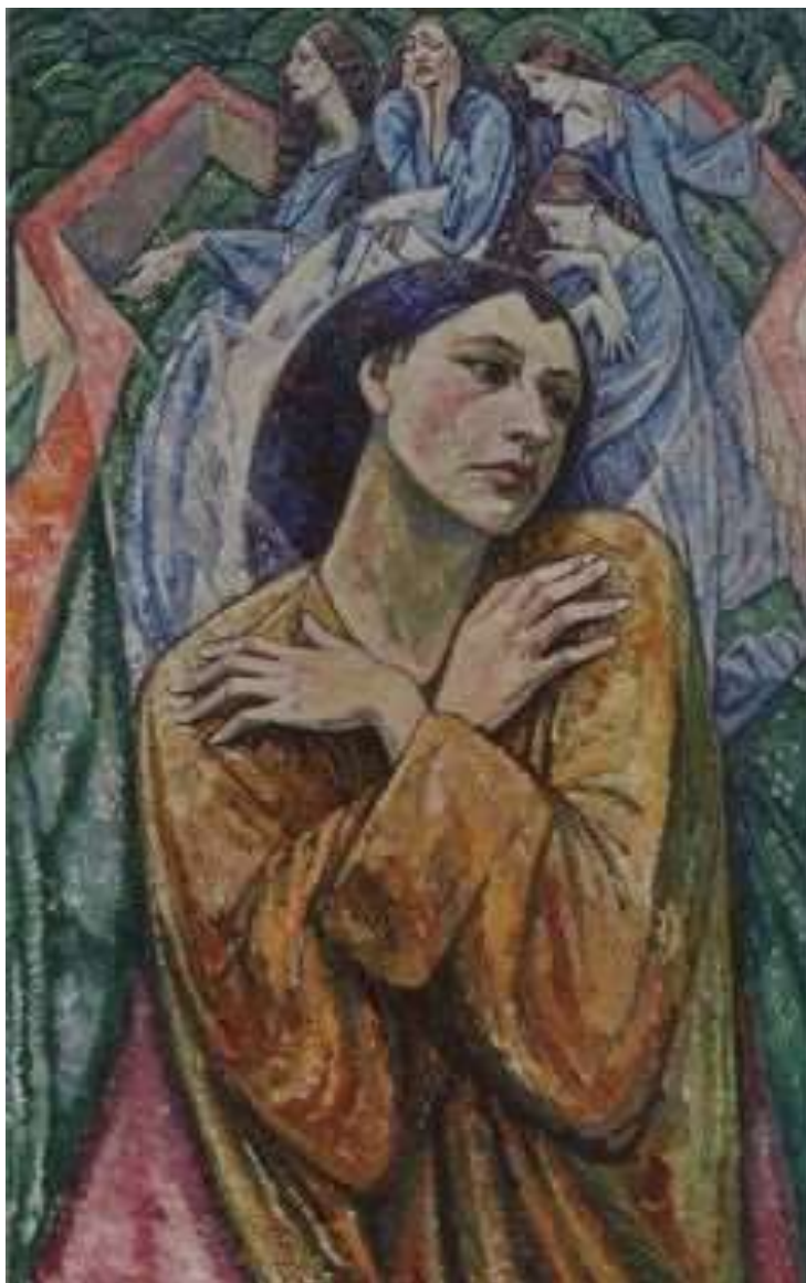
„Das Leiden der Frau im Kriege oder Trauernde Frauen”, 1918

von Johann Heinrich Vogeler deutscher Maler, Grafiker, Architekt, Designer, Pädagoge, Schriftsteller und Sozialist (1872 – 1942).