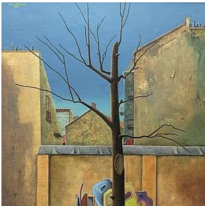
„Baum in der City“, 1986 (21 x 21 cm, Öl auf Holz)

Doris Nefedov alias Alexandra (1942 – 1969), deutsche Sängerin