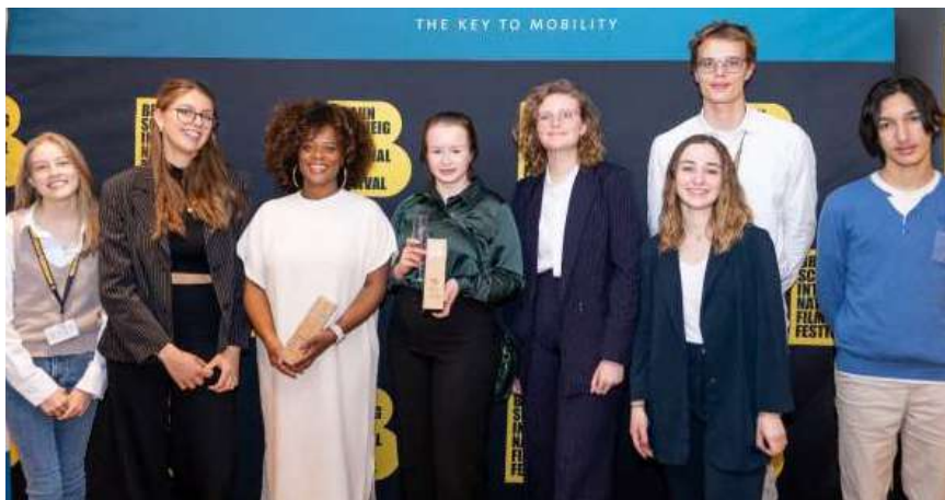
Les membres du jury Kinema avec les deux actrices principales du film.