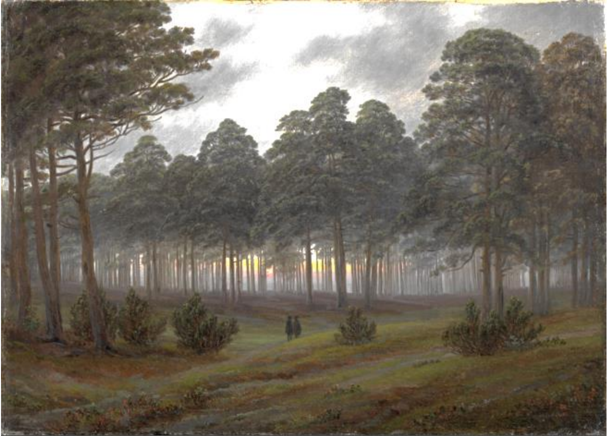
Caspar David Friedrich, Der Abend , 1821, 22cm x 30,5cm, Landesmuseum Hannover